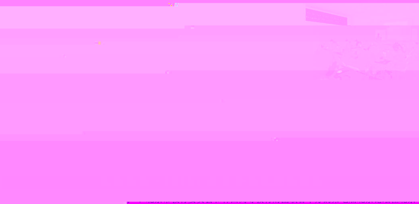
举行“文明论坛”《文明的进程与共同使命》——暨“

的文明进程，有赖于教育。正是教育塑造了人类的文明。在教育这一漫长的过程中，人类文明得以不断传承，并在此过程中不断进步。文明是人类共同的事业，也是人类共同的责任。我们作为教育者，肩负着传承文明、创造文明的神圣使命。我们要坚持以人为本，立德树人，培养具有高尚品德、扎实学识、创新精神和实践能力的人才。我们要坚持以改革创新为动力，深化教育教学改革，提高教育质量和水平。我们要坚持以服务社会为己任，为社会主义现代化建设培养更多优秀人才。我们要坚持以开放包容为胸怀，吸收借鉴人类文明的一切优秀成果，推动人类文明交流互鉴、共同进步。我们要坚持以人民为中心，办好人民满意的教育，让每个孩子都能享有公平而有质量的教育，让教育成为民族振兴和社会进步的基石。