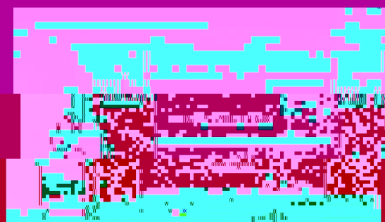
教育学院2010年度学术交流会会场

会议期间,各系系主任分别作了工作报告,汇报了各自系的工作情况。会议在热烈的掌声中圆满结束。